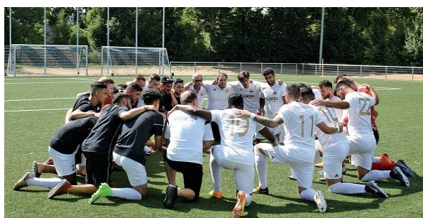
▲ 建立一個堅固團隊，要有健康的溝通及互相信任。

工場上的團隊成員需要定期做團隊建立和溝通的練習。如果有嫌隙，可能需要一位團隊以外、被眾人信賴的人幫忙和解，並教導健康的溝通模式，才能慢慢跨過磨合期，成為堅固的團隊。