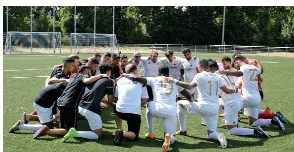
▲ 建立一个坚固团队，要有健康的沟通及互相信任。

工场上的团队成员需要定期做团队建立和沟通的练习。如果有嫌隙，可能需要一位团队以外、被众人信赖的人帮忙和解，并教导健康的沟通模式，才能慢慢跨过磨合期，成为坚固的团队。